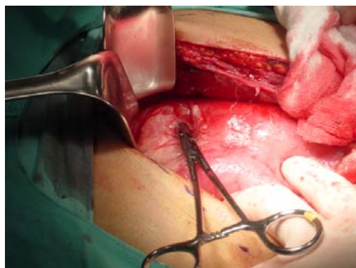
pinza demostrando la perforación gástrica

Con el diagnóstico presuntivo de una tumoración gástrica (bezoar) de origen a determinar + probable perforación de estómago la paciente fue sometida a una laparotomía exploradora en la cual se encontró una perforación en la cara anterior del estómago. Además se observó que el estómago estaba ocupado por una masa. Al abrirse éste, vimos que dicha masa correspondía a un bezoar formado de cabello, lo que lo cataloga como tricobezoar . El tricobezoar fue extraído de forma completa, con un peso de 1 kilogramo y semejando un molde de estómago y duodeno. Posteriormente el estómago se reparó. La intervención se concluyó sin complicaciones ni incidentes.