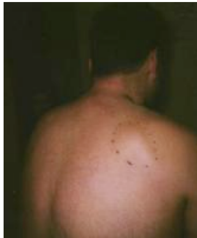
Lipoma en Espalda

La mayoría se localizan en el tronco (tórax y abdomen), muslos y antebrazos, pero pueden presentarse en cualquier región que contenga grasa. Usualmente son pequeños, con un tamaño promedio entre 1-3 cm. En raras ocasiones crecen más.