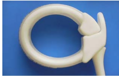
Banda sin líquido

4.- Una vez obtenido el ajuste exacto, el paciente puede irse a su domicilio. NO HAY necesidad de internarse en un hospital.